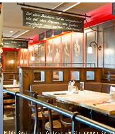
Bild: Restaurant Watzke am Goldenen Reiter