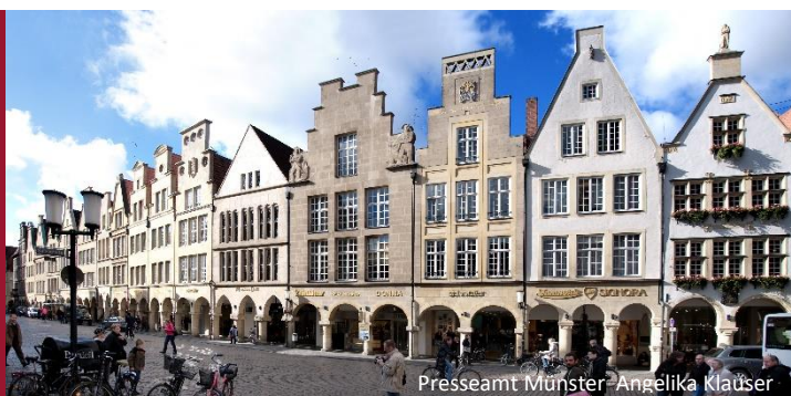
Presseamt Münster Angelika Kläuser