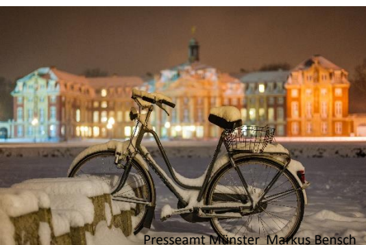
Presseamt Münster Markus Bensch