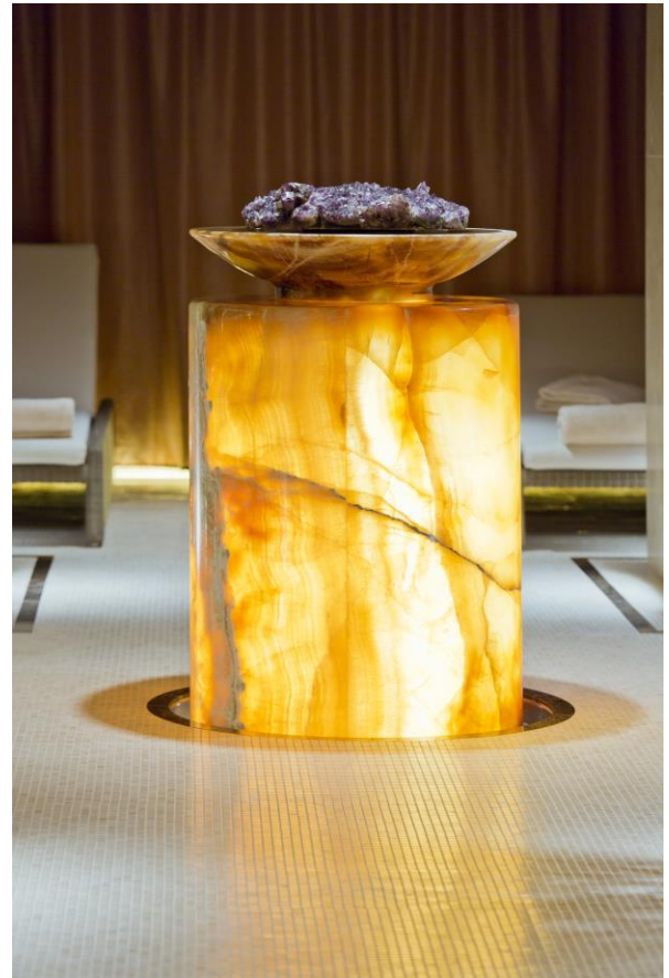
Bild 3: „Einzigartiger Blickfang: Die Säule aus Onyx empfängt die Gäste im Wellnessbereich eines Fünf-Sterne-Hotels.“