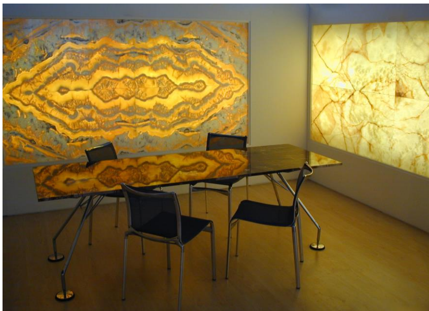
Bild 5: „Gemälde aus Stein: Die gespiegelten Wandbekleidungen aus Onyx zeigen, wie vielfältig der Steinmetz mit Naturstein gestaltet.“