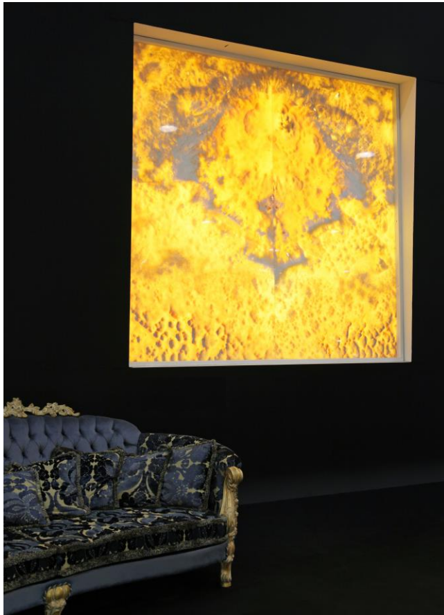
Bild 2: „Stilvolles Interieur: Licht bringt die Schönheit der gespiegelten Onyx-Platten glanzvoll zur Geltung.“