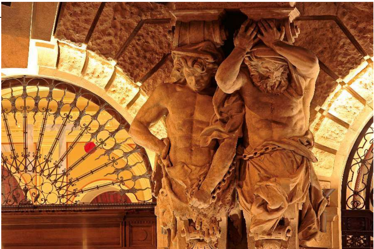
Detailarbeit Stadtgebiet Budapest – Referenz Firma Reneszansz; https://www.reneszansz.hu/

Idee und Organisation: Hilke Domsch Geokompetenzzentrum Freiberg e.V. Korngasse 1, 09599 Freiberg hilke.domsch@gkz-ev.de +49-3731-773714, +49-1525-4297233