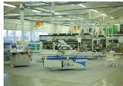
Oben: CNC-Maschinenfertigung Biesse made Hungary Unten: Fischerbastei Budapest

15:00 Uhr Fachgespräch Möglichkeiten und Grenzen maschineller CNC-Bearbeitung bei individuellen Fertigungen mit Naturwerkstein Fa. Biesse – Formance IP. Ker.Es Szolg. Kft. Biatorbágy, Tormásrét u. 4, 2051 Ungarn https://biesse.com / http://www.formance.hu