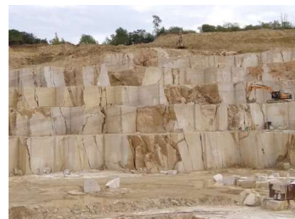
Oben: Steinabbau Süttő Unten: Der rote Kalkstein von Tardos

14:00 Uhr Abfahrt nach Budapest 65 km – 1 h