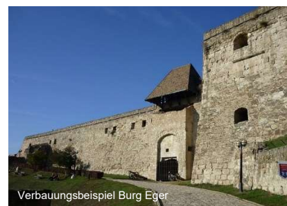
Verbauungsbeispiel Burg Eger