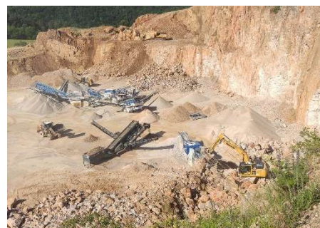
Steinbruch Tuhár: https://www.facebook.com/people/Geofarma/61565459486891/?_tn=-UC*F

9:00 Uhr Ankunft in Tuhár Besuch des Marmorsteinbruchs Tuhár, Geofarma s.r.o. Tuhár 182, 98512 Tuhár https://www.mineralgroup.sk/