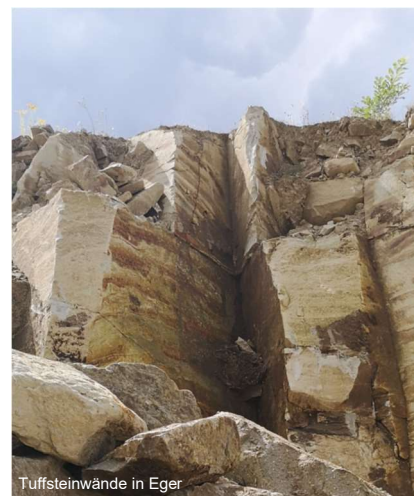
Tuffsteinwände in Eger